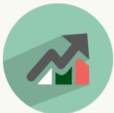
Resultados Inicio y Final Encuesta de Percepción.