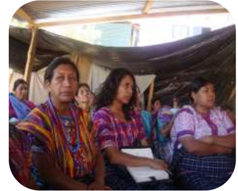
Planes y acciones a nivel Macro