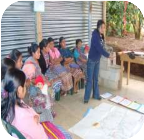
Desarrollo de alianzas y tejido social a nivel Micro