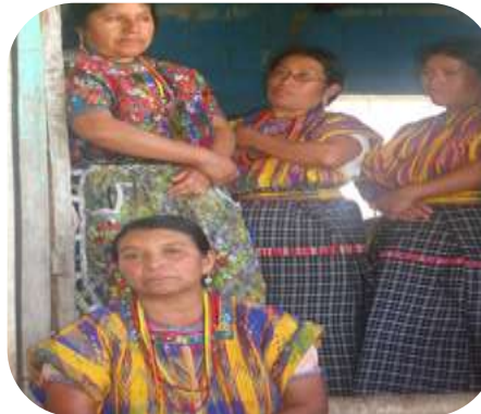
Generar capacidad económica que de sostenibilidad a la ODB