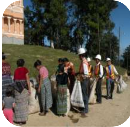
Dificultad de interrelación a nivel meso